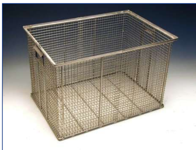
Korb geeignet für Röhrradanlagen