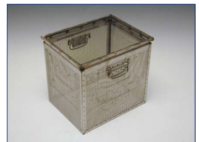
Kasten im Sondermaß