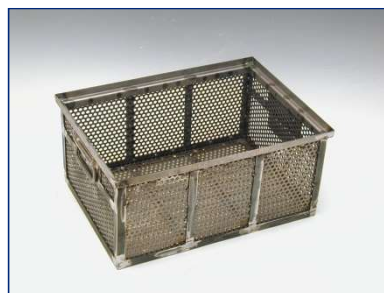
Kasten mit Verstärkungsstreben