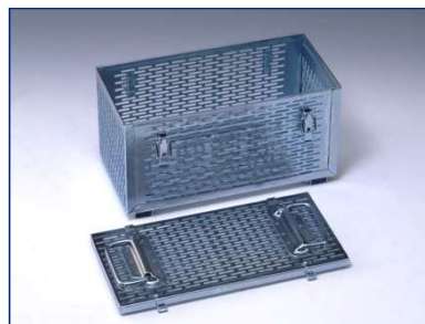
..... Einsatzkasten mit Deckel und Verschlussbügeln