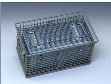
Drahtgitterkorb mit .....