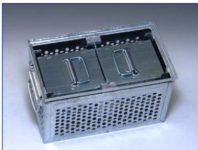
Spezieller Kasten mit Führungen zu Arretierung von