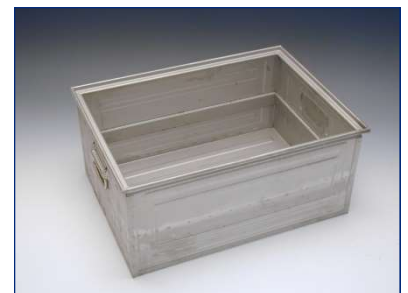
Kasten feines Lochbild mit Verstärkung