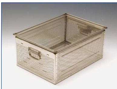
Lochblechkasten aus Edelstahl