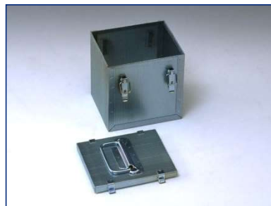
2 Einsatzkörben mit Deckel und Verschlussbügeln