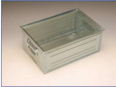
Als Sonderausführung auch für kleine Lochdurchmesser (ab 0,8 mm) lieferbar