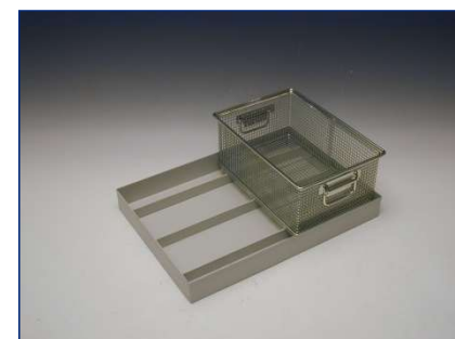
Korb und Auffangwanne