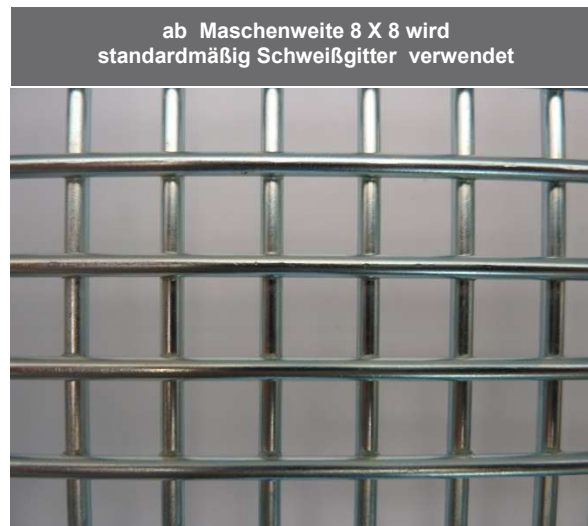
ab Maschenweite 8 X 8 wird standardmäßig Schweißgitter verwendet