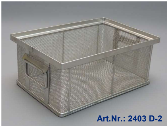
Art.Nr.: 2403 D-2