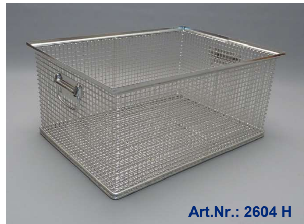
Art.Nr.: 2604 H